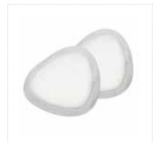
Stilleinlage NoShow Premium™

Die Einmal-Stilleinlagen NoShow Premium™ sind aus Hygienegründen einzeln verpackt. Dank der Einzelverpackung ist es möglich, die Einweg-Stilleinlage ohne Angst vor Verschmutzungen in jeder Hand- oder Wickeltasche mitzunehmen.