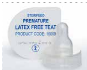
Sauger für Frühgeborene