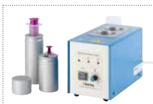
Reduziereinsätze / Flaschenwärmer clinitherm baby für zwei Flaschen