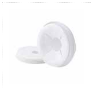
Brustwarzenformer mit Komforteinlage