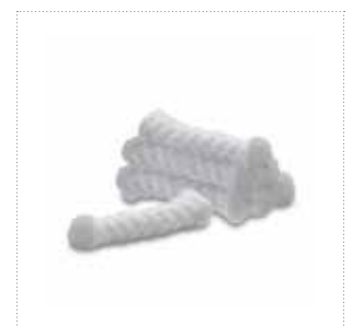
Saugeinlagen für Brustwarzenschutz