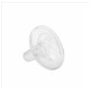
Flexishield™ Areola Stimulator