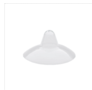
Brusthütchen, Größe 2