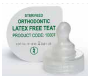
Sauger für Neugeborene in kieferorthopädischer Form