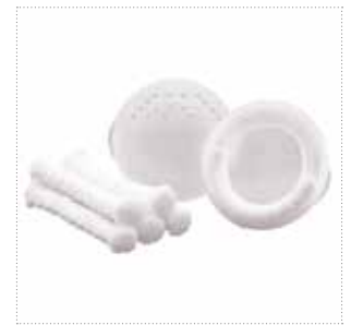
Brustwarzenschutz mit Saugeinlage