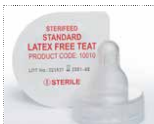
Sauger für Neugeborene