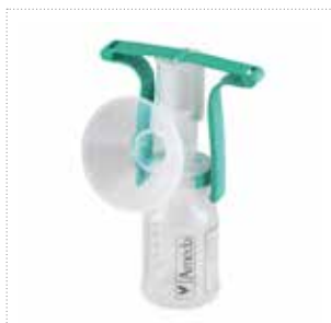
Einhandpumpe mit Flexishield™