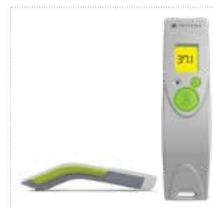
TriTemp™ kontaktloses Infrarot-Thermometer