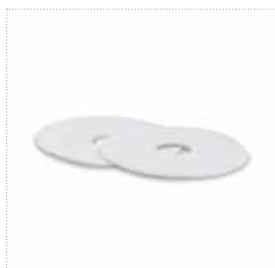
Komforteinlagen für Brustwarzenformer