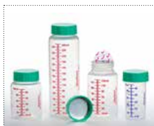
Flaschen mit Verschlussfoliensiegel